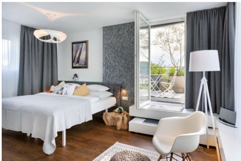
Das Mosaic House will seinen Gästen Ruhe verschaffen. Deshalb ist das Interieur in hellen und cleanen Farben gehalten.

Bis auf das Betonskelett, die Gebäudehülle und einige denkmalgeschützte Teile wurde das heutige Mosaic House Prag 2010 schon einmal saniert. Im Januar 2020 starteten dann erneut für drei Monate die Renovierungsarbeiten im Inneren des Hauses. Nun ist das Hotel nicht nur von außen ein Highlight, sondern überzeugt auch mit seinen inneren Werten.