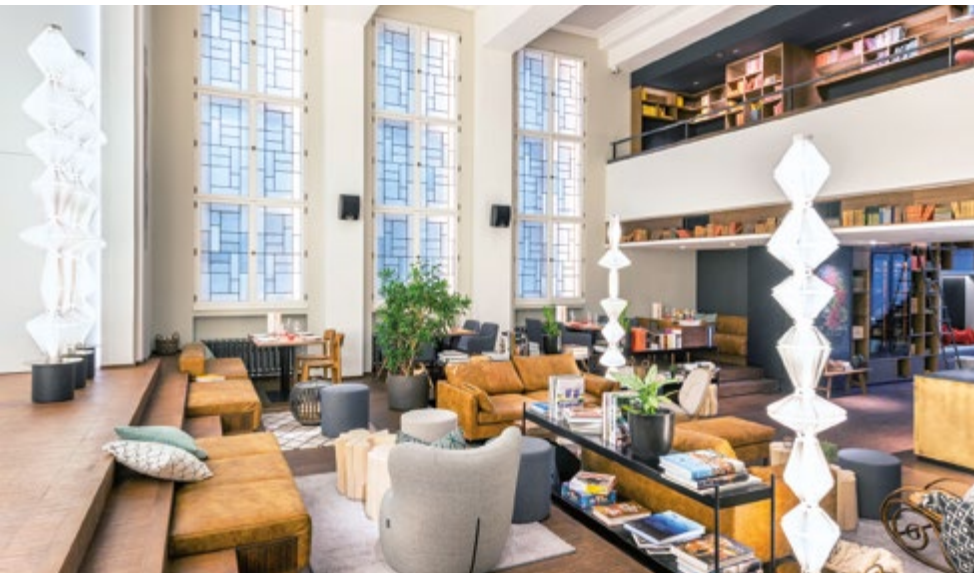
Das Café Mosaic bietet seinen Gästen neben Kaffee und Kuchen auch Bücher für eine Reise in eine andere Welt. Die Terrassen im sechsten Stock sind begrünt und ermöglichen einen Blick über die Stadt.

Das historische Gebäude und das Grundstück selbst waren ursprünglich zu 100 Prozent bebaut. Es gab keine Pflanzen, keine Vegetation. Im Rahmen der Umbauarbeiten wurde aber auch hier etwas getan. Für Insekten und Vögel wurde durch eine umfassende Dachbegrünung neuer Lebensraum geschaffen. Hinzu kamen 300 Pflanzenbehälter und Bäume, sodass 40 Prozent der Grundstücksfläche nun begrünt ist.